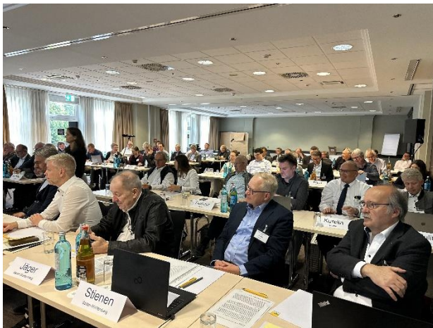
Anfang Mai 2024 trafen sich die Delegierten des h1b in Schwerin.

Besonders intensiv wurde in Schwerin über die verschiedenen Optionen zur Umbenennung des h1b diskutiert. Die neue Bezeichnung „ h1b -Bundesvereinigung“ umgeht das Problem, dass im bisherigen Vereinsnamen „Hochschullehrerbund – Bundesvereinigung e.V.“ nur die männliche Form explizit genannt wird. Angelehnt an den neuen Namen lautet die Beschreibung des h1b nun: „Bundesvereinigung der Professorinnen und Professoren für angewandte Wissenschaften.“ Neu ist auch der Claim, der jetzt „Wir sind die Stimme der angewandten Wissenschaften“ heißt.