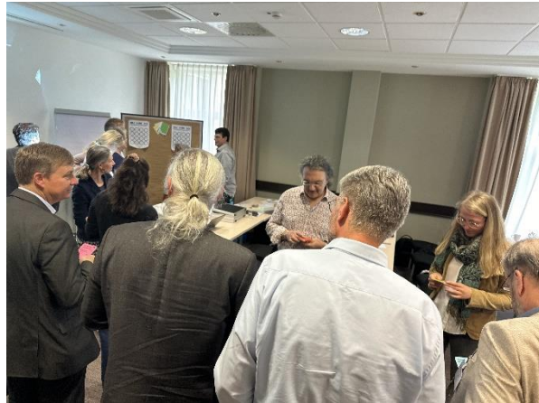
Spielerisch näherten sich die Teilnehmerinnen und Teilnehmer des Workshops an das Thema Demokratie an

Koch: Ich bin davon überzeugt, dass wir bei der Vermittlung eines Demokratieverständnisses weiterkommen, wenn wir unseren Studierenden nicht nur Fakten und Wissen weitergeben im Sinne von: Welche demokratischen Institutionen kennen wir? Welchen Einfluss hat die EU? Oder was ist Föderalismus? Demokratie ist Meinungsbildung, Zuhören, Argumente austauschen und gute Quellen von schlechten Quellen unterscheiden – und das müssen wir als Professorinnen und Professoren unseren Studierenden vorleben und ihnen den Raum geben, diese Fähigkeiten zu erlernen und anzuwenden. Die Angebote von ScoPE sind dabei eine Unterstützung. In ScoPE stellen wir Methoden und Werkzeuge für unsere Kolleginnen und Kollegen an der Frankfurt UAS zur Verfügung, um den Demokratiediskurs zu unterstützen, z. B. Demokratiespiele, und laden auch Referentinnen und Referenten ein, die über aktuelle politische Themen informieren, diese transparent machen und somit auch Fake News entgegenwirken.